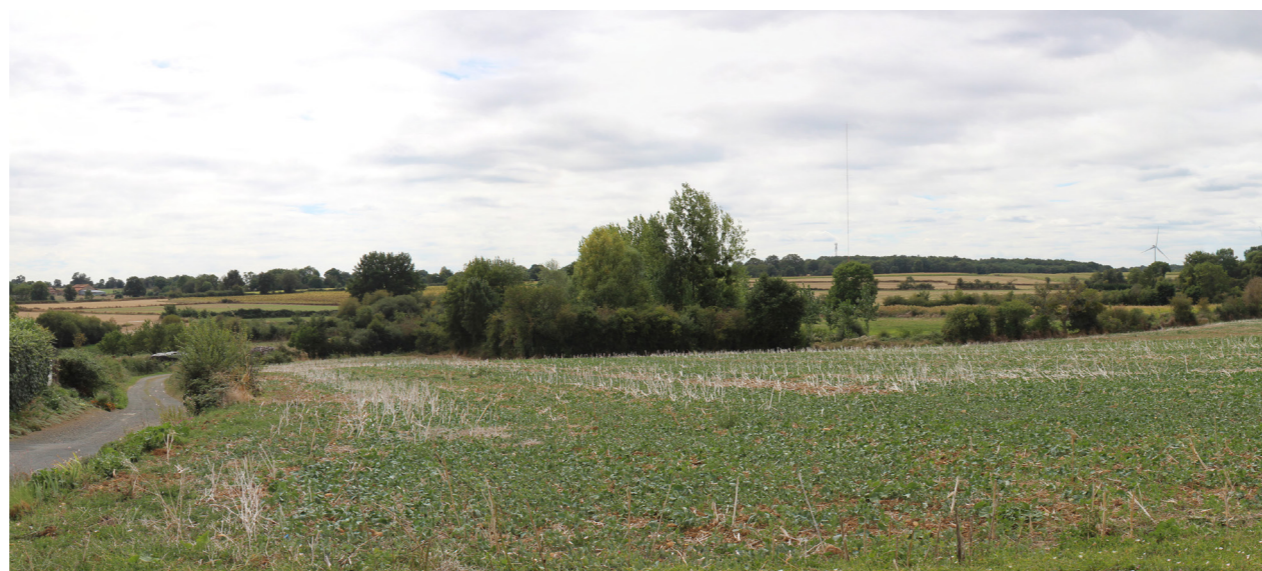
Photographie de l'état initial à 50°